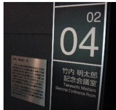
63号館 2階 63-02-04