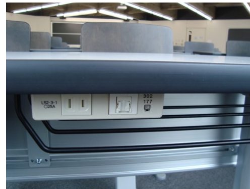
各学生席にネットワーク端末が常設されています。