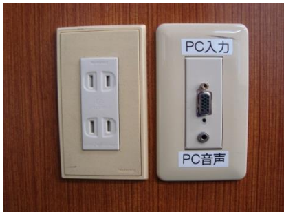
AVラック側面の端子

●パソコンをAVラック側面の端子と接続します。ケーブルは各自ご用意ください。用意できない場合は52号館AV支援室にて貸与いたします。