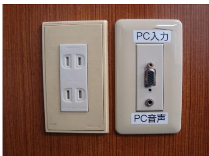
AVラック側面の端子

●パソコンをAVラック側面の端子と接続します。ケーブルは各自ご用意ください。用意できない場合は52号館AV支援室にて貸与いたします。