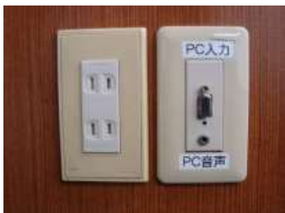
AVラック側面の端子

●パソコンをAVラック側面の端子と接続します。ケーブルは各自ご用意ください。用意できない場合は52号館AV支援室にて貸与いたします。